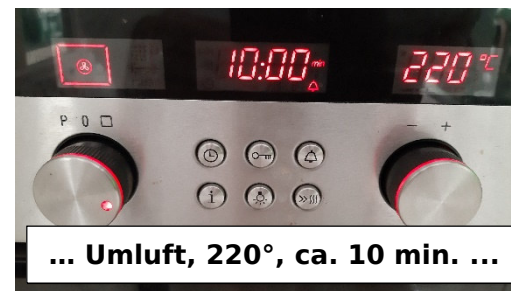
... Umluft, 220°, ca. 10 min. ...