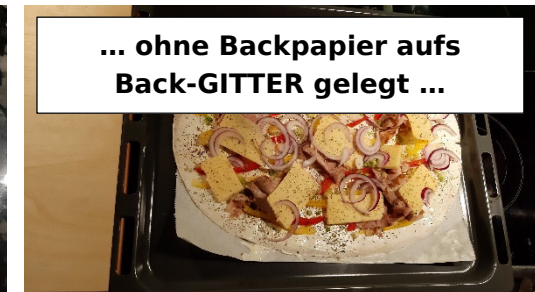
... ohne Backpapier aufs Back-GITTER gelegt ...