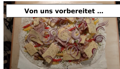
Von uns vorbereitet ...